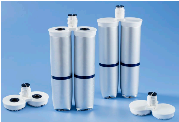
Faltbare filmbasierte Doppelkartuschen verfügen über wiederverschließbare Düsenöffnungen um Material zur späteren Verwendung zu lagern.