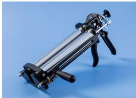
Manuelle Dosierpistole mit eingebautem Film-Pak-Halter

Film-Pak-Kartuschen funktionieren mit einer breiten Palette von 2K-Dosierpistolen. Nordson EFD bietet manuelle, pneumatische und schnurlose Pistolen in mehr als zehn Modellen an, einschließlich spezialisierter Pistolen mit eingebauten Film-Pak-Haltern. Wenn Sie mehr erfahren möchten, besuchen Sie www.nordsonefd.com/2KDispenseGuns .