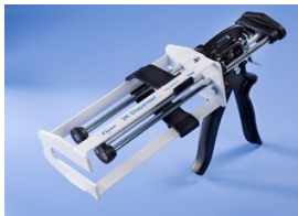
Manuelle Dosierpistole, die nachgerüstet werden kann, um Film-Pak-Kartuschen zu verwenden.