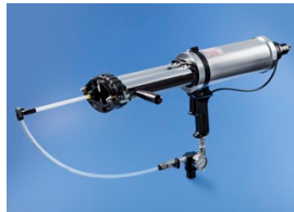
HSS Sprühsystem mit eingebautem Film-Pak-Halter