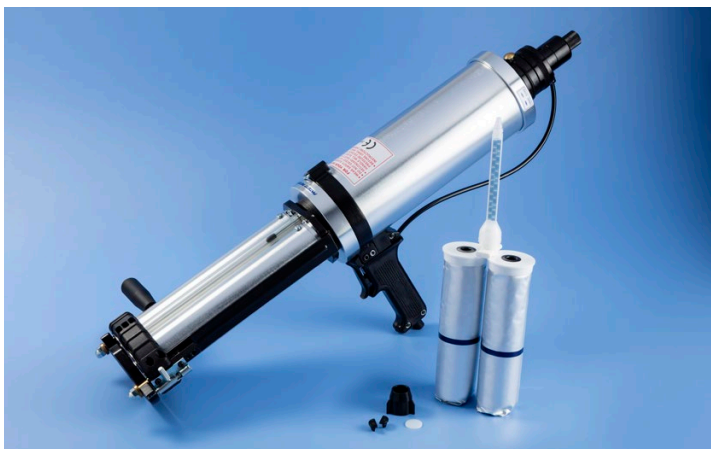
Komplette 2K-Dosiersysteme beinhalten spezialisierte Dosierpistolen mit eingebauten Film-Pak-Haltern.