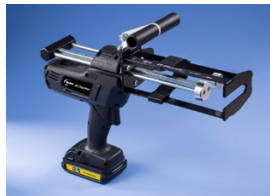
Schnurlose Dosierpistole, die nachgerüstet werden kann, um Film-Pak-Kartuschen zu verwenden.