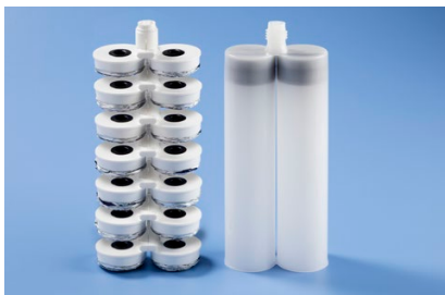
Sieben komprimierte Film-Pak-Kartuschen verbrauchen den Platz einer Festkörperkartusche auf Mülldeponien.