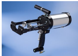
Pneumatische Dosierpistole, die nachgerüstet werden kann, um Film-Pak-Kartuschen zu verwenden.