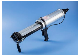
Pneumatische Dosierpistole mit eingebautem Film-Pak-Halter