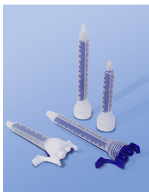
Les adaptateurs SmartLok™ sont conçus pour adapter les mélangeurs OptiMixers aux cartouches doubles F-System.