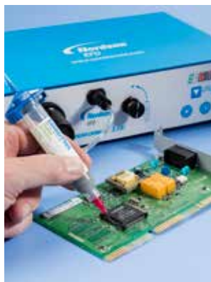
SolderPlus® はんだペーストの PCB への塗布。