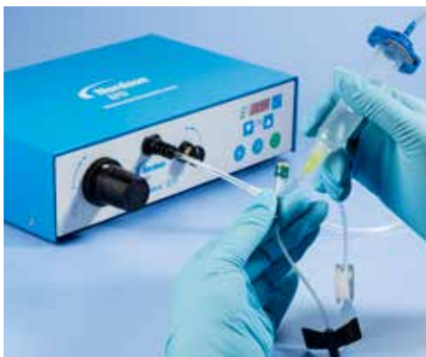
低粘度液剤の医療機器への塗布。